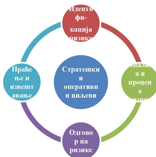
Слика 1. Процес управљања ризицима

Процес управљања ризицима састоји из четири основна корака која се примењују и на стратешке и на оперативне ризике: 1) идентификација ризика; 2) анализа и процена ризика; 3) одговор на ризике; и 4) праћење и извештавање.